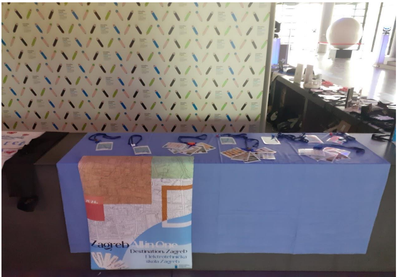
Slika 1 i 2 Izgled štanda na kojemo izožili svoj projekt kartice – Zagreb All in One