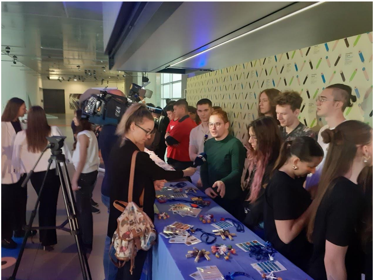
Slika 3 i 4 Davanje intrvjua za HTV i OTV televiziju na štandu gdje smo izložili naše kartice