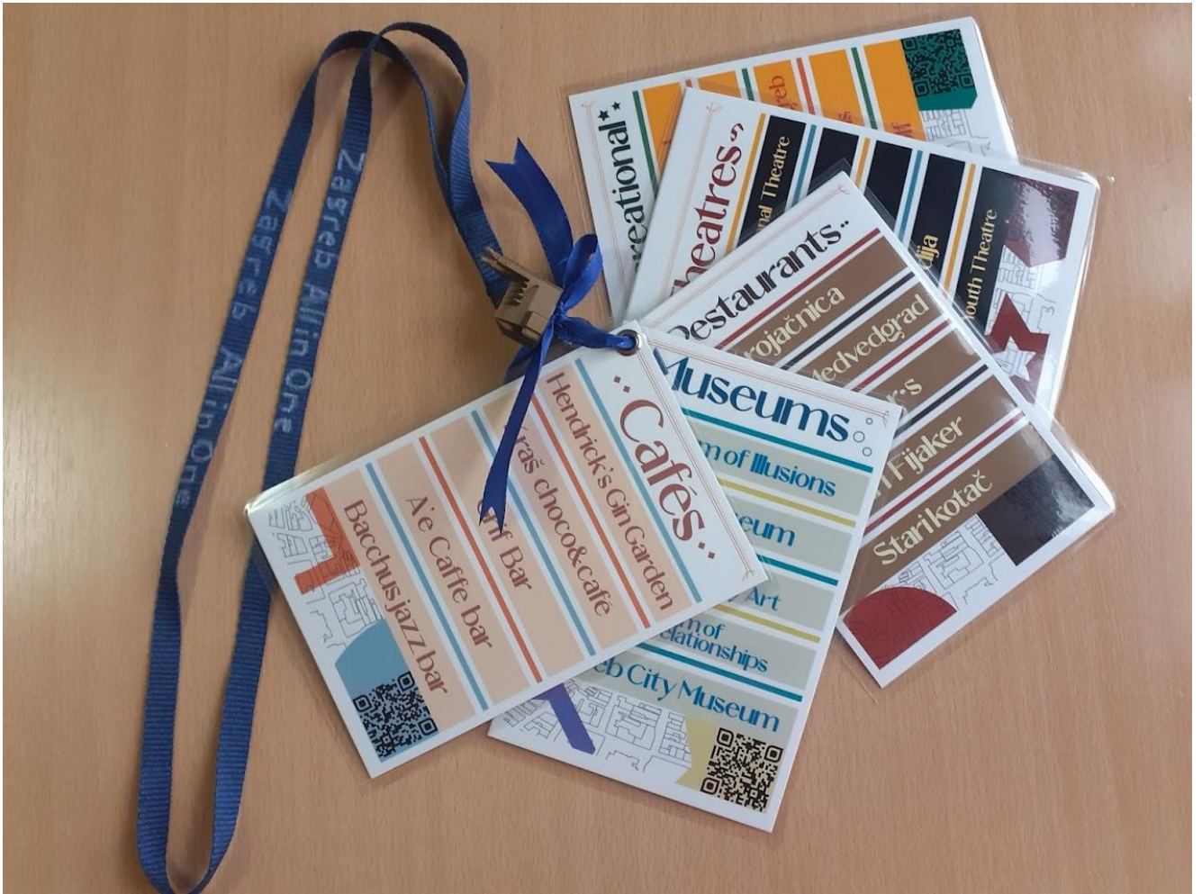
Slika 8 i 9 Prednja i stražnja strana kartica kao vodiča i suvenira – naš projekt Zagreb All in One